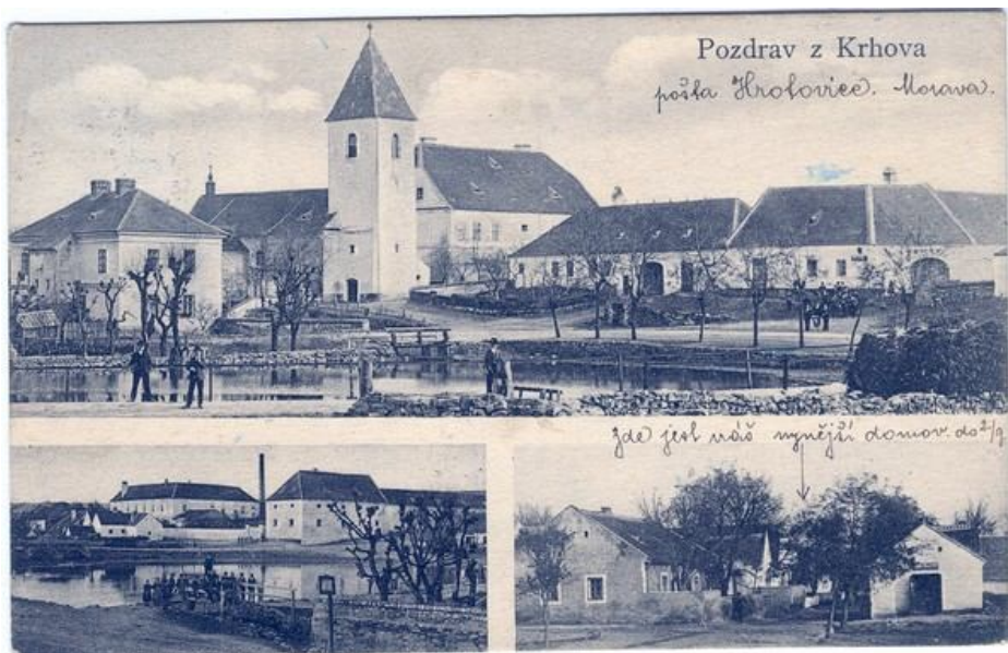
Pohlednice Krhova z roku 1912